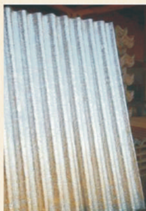
Telha feita de caixas longa vida

Embora não falte mercado para os recicláveis no Brasil, ele ainda não é dos mais promissores. Entretanto, amplia-se cada vez mais. Veja o exemplo das embalagens longa vida (Tetra Pak®):