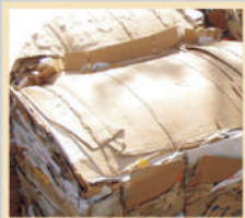
Reciclagem do papel