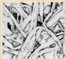
Fibras do papel