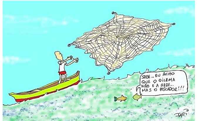
[Sabe...Eu acho que o dilema não é a rede... mas o pescador!!!]

(Adaptado de Mauro Iasi, O dilema do dilema das redes: a internet é o ópio do povo. Blog da Boitempo. Disponível em https://blogdaboitempo.com.br/o-dilema-do-dilema-das-redes-a-internet-e-o-opio-do-povo/ . Acessado em 10/10/2020.)