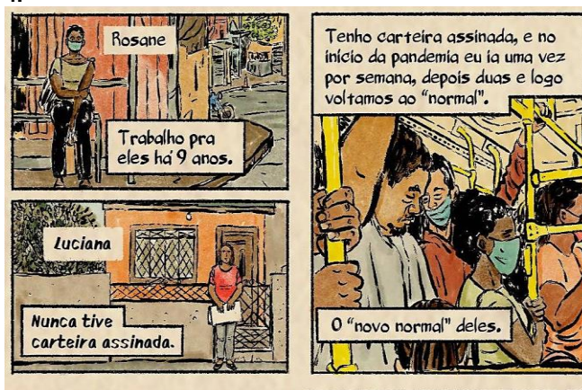
(Adaptado de Confinada . Roteiro de Triscila Oliveira e Ilustração de Leandro Assis. Disponível em @leandro_assis_ilustra. (Instagram). Acessado em 14/12/2020.)

5. O chefe de governo negou a gravidade do problema, insultou os coveiros, promoveu aglomerações e espalhou desinformação sobre o distanciamento, a higienização e o uso de máscara. Jogou com a vida dos que acreditaram em um remédio inócuo, a cloroquina, e nisso comprometeu o Exército e o SUS. Desmoralizou os médicos Ministros da Saúde, ignorou medidas que inibiriam a evolução da doença e deixou mofar milhões de testes que ajudariam a salvar vidas. Após atribuir poderes políticos às vacinas, o governo federal se dedica agora, negando uma cultura de cem anos, a minar a confiança nelas. Por ele, a pandemia nunca será superada. (Adaptado de Ruy Castro, Os médicos sobre Bolsonaro. Disponível em https://www1.folha.uol.com.br/colunas/ruycastro/2020/12/os-medicos-sobre-bolsonaro.shtml . Acessado em 14/12/2020.)