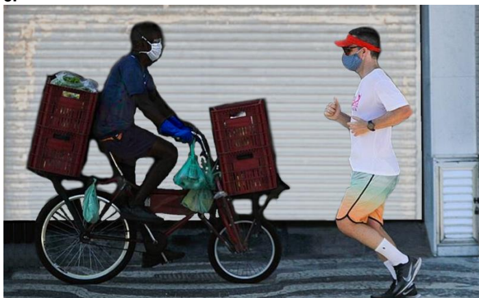
(Adaptado de Pedro Conforte / Plantão Enfoco. Disponível em https://www.brasildefato.com.br . Acessado em 28/09/2020.)